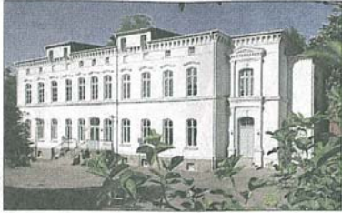
◀ Das Museum am Amtsberg 1 in Wittenburg öffnet einmal im Monat seine Türen. Anfragen für Termine unter Telefon: (040) 402 84 03 90.

Am Strand von Dubai fand ein Wohltorfer einen Mehlsack und kam auf eine ungewöhnliche Idee.