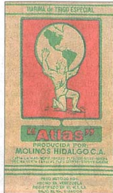
Das Bild oben zeigt die Jungfrau von Covadonga, das untere Atlas, der nach griechischem Mythos den Himmel trug.